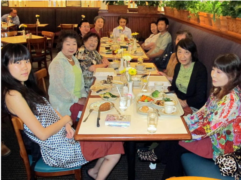
(写真は5月のおしゃべり会より)

「おしゃべり同好会」では老若男女、10名程が月一回美味しいランチを頂きながら楽しいおしゃべりに花を咲かせています。7月のおしゃべり会は THE WESTIN HOTEL MEMORIAL CITY の中のイタリアンレストラン、「TRATTORIA IL MULINO」で開かれました。8月の会合に関するご案内はEメールリングリストを通じて発信致しますので、ご参加を希望される方は今後のEメール連絡にご注目ください。